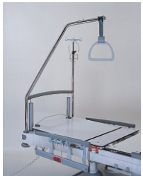
инфузионная стойка и устройство для приподнятия пациента