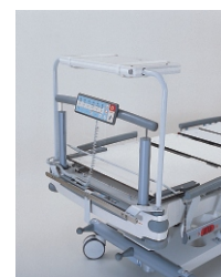
полочка для прикроватного монитора