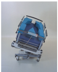
комплект матрасов для латеральных наклонов