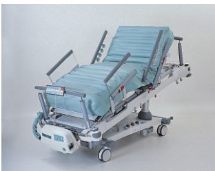
противопролежневый матрас с пневмокомпрессором