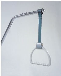
устройство для приподнятия с регулировкой высоты