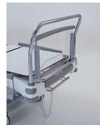
держатель системы для вытяжения