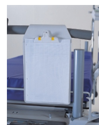
держатель листа наблюдений