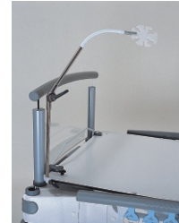
держатель анестезиологических шлангов и трубок