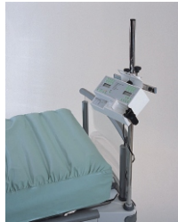
держатель инфузионной помпы