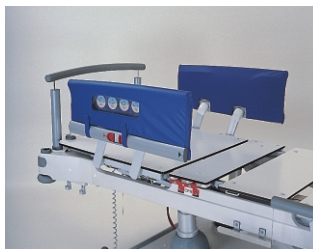
чехлы для боковых ограждений