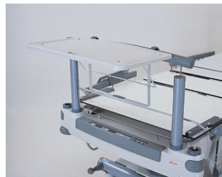
полочка для записей и лекарств